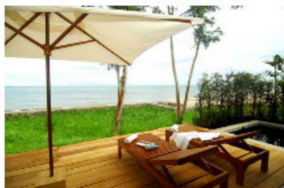
Farniente ou activités dans les environs de Kui Buri.