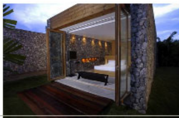
Pierre et bois à l'hôtel X2 de Kui Buri.