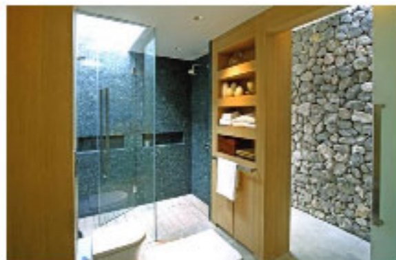
Lignes épurées jusque dans la salle de bain.