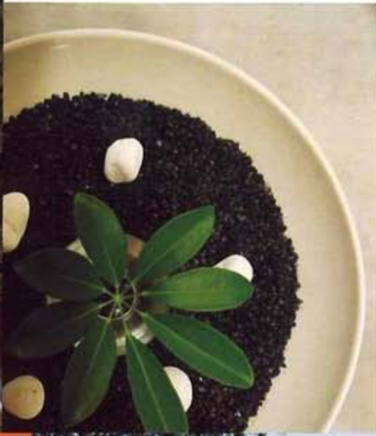
ความโรแมนติกสำหรับคู่รักสไตล์ X2 ไม่มีดอกไม้ประดับ แต่เป็นการดื่มด่ำกับบรรยากาศรอบตัว